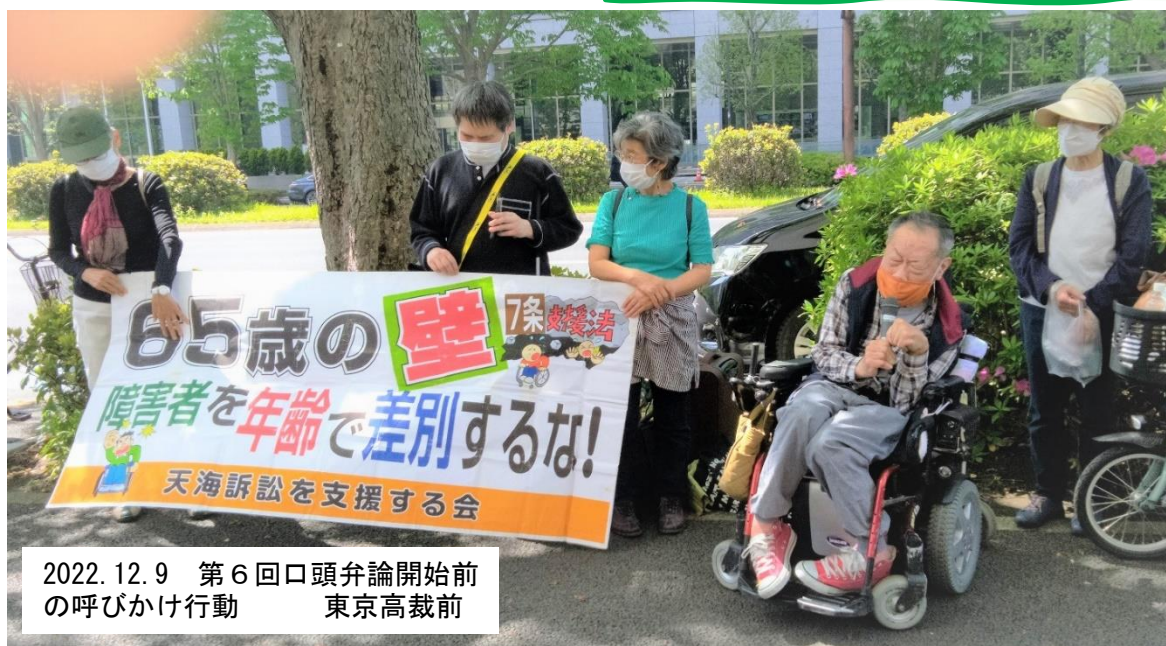
2022. 12. 9 第6回口頭弁論開始前の呼びかけ行動 東京高裁前